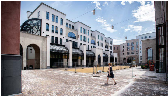
DOOR VIKKIE BARTHOLOMEUS